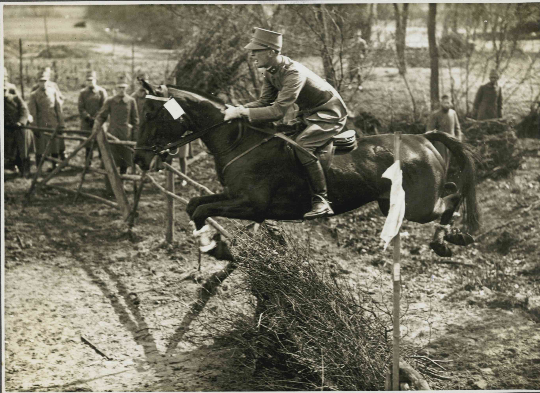
Luit. van der Hoog op Nut d' IJssse