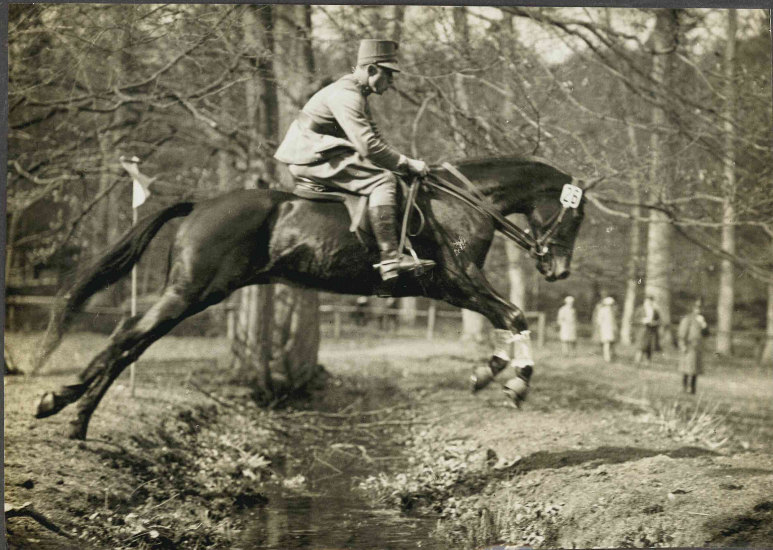
Suit. Jleken met Juone (v.p.) N° 24.