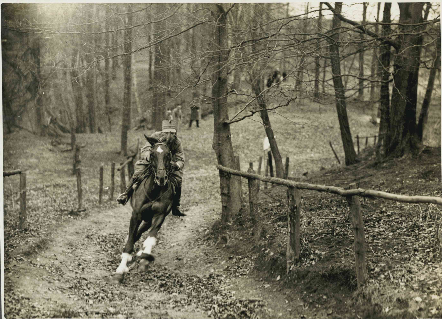
Suit. Momma mit Waquette N° 11