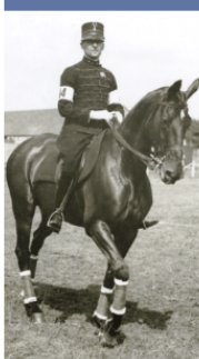
Generaal Dolf van der Voort van Zijl, hier in het destijds correcte rijtenue van de Cavalerie, de attila, won als luitenant in 1924 in Parijs met Silver Piece (op de foto) de eerste twee gouden Olympische medailles uit de geschiedenis van de Nederlandse ruitersport: in de military (thans eventing), zowel individueel als in teamverband

Dit is deel 2 uit een serie over correct militair optreden te paard. Deel 1 ging over het militair rijtenue (klik hier ).